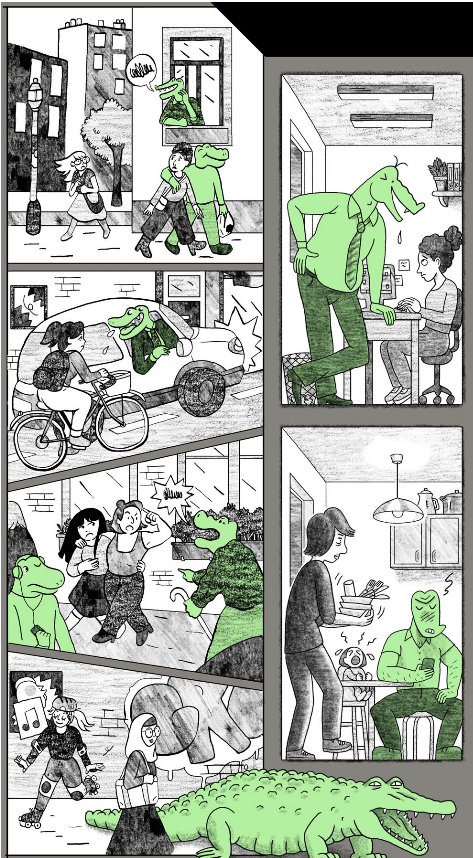
Originele tekening van de muurschildering "Krokodillen"