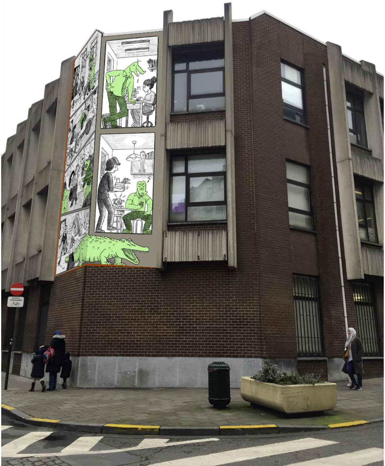
Visualisatie van de muurschildering "Krokodillen" 6