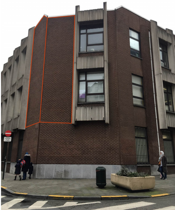
Locatie van de muurschildering op de hoek van de Kanonstraat en de Koolstraat te 1000 Brussel